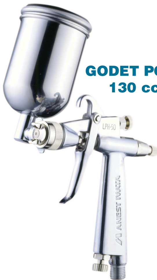
GODET PC61 130 cc