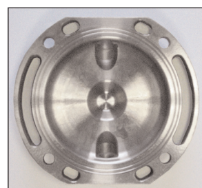
FLASQUE: Flasque en INOX polie pour une meilleure rinçabilité